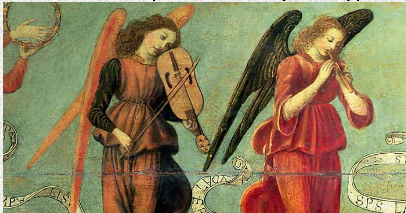
Francesco Botticini - Angeli che suonano